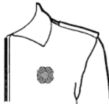
All-season jacket Manteau toutes-saisons

Wearing of the Poppy (left pocket) - Port du coquelicot (poche de gauche)